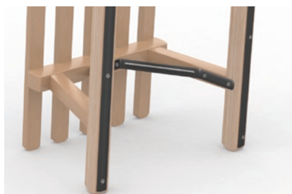
Vinylplane Frontlit B1